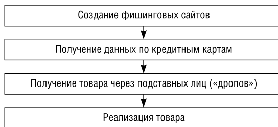
Рис. 1. Схема работы кардеров

Также на рынке Internet-провайдеров произошёл перекоп в ценах — в то время как для физических лиц широкополосный доступ сильно подешевел, для организаций все осталось на прежнем уровне. Кроме того, арендаторы зачастую не имеют возможно-